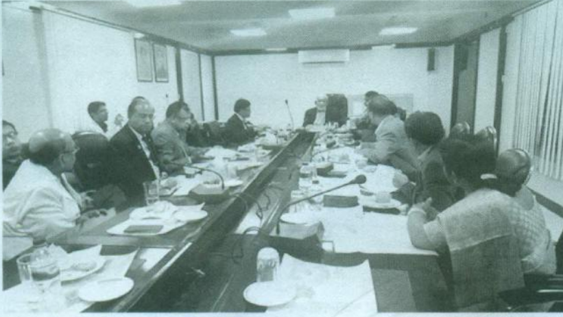
চট্টগ্রাম বিশ্ববিদ্যালয়ের পরিদর্শক টিমের সাথে হাসপাতাল কার্যনিবাহী কমিটির বৈঠক।

চট্টগ্রাম বিশ্ববিদ্যালয়ের একটি পরিদর্শক টিম গত ২৮/১২/২০১৬ ইং তারিখ চট্টগ্রাম মা ও শিশু হাসপাতাল পরিদর্শন করেন। পরিদর্শক টিম চট্টগ্রাম মা ও শিশু হাসপাতালের অন্যতম প্রকল্প শামসুন নাহার খাঁন নার্সিং কলেজে বিএসসি ইন নার্সিং কোর্স চালু করার জন্য উপযোজন ও হাসপাতালের বিশেষায়িত